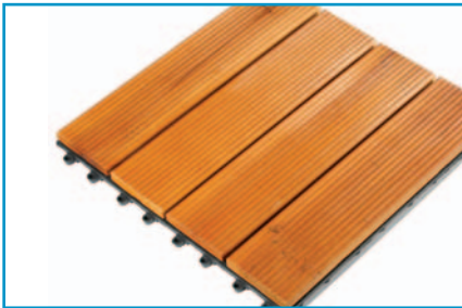
Naturholz Fliesen ca. 300 x 300 x 25 mm

Durch das neuartige Trägersystem sind Ihre Fliesen schnell und sicher auf allen festen Untergründen verlegt. Die wetterbeständige Konstruktion ist optimal für alle Nass- und Außenbereiche geeignet. Für das Verlegen benötigen Sie kein zusätzliches Werkzeug.